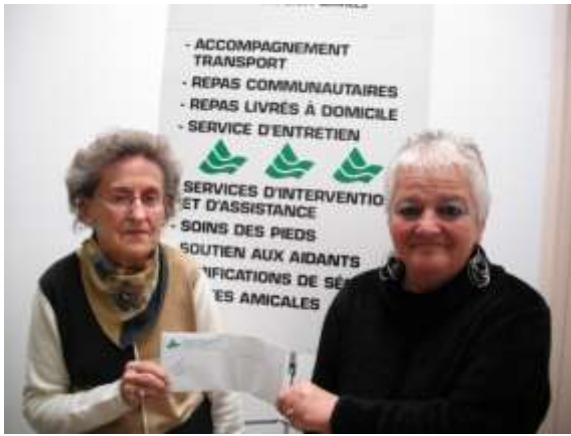
Sur la photo : la gagnante du tirage mensuel du